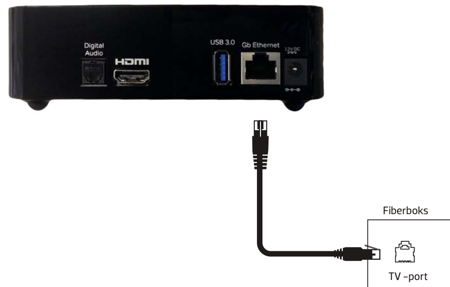
Figur 1: Tilslutning af TV-boks til TV-port i din fiberboks.

Se i din vejledning til fiberboksen hvilke porte, der er TV-porte.