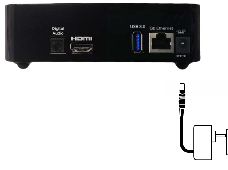
Figur 3: Forbindelse til strømudtag.

Forbind strømforsyningen med TV-boksen (indgangen mærket "12V DC"). Sæt herefter strømforsyningen i en stikkontakt (figur 4).