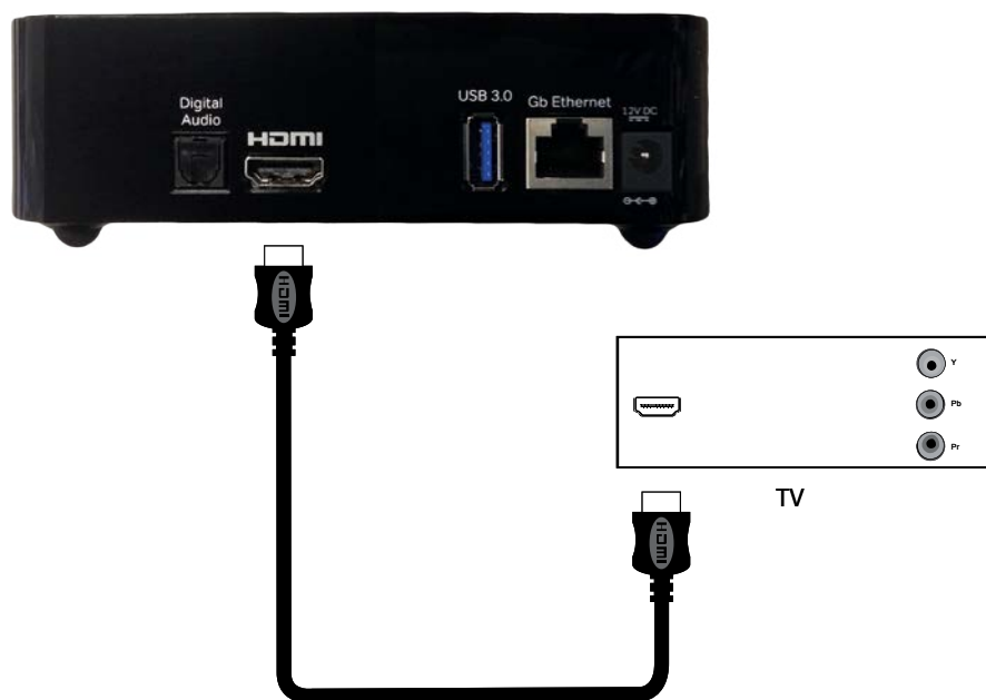
Figur 2: Tilslutning med HDMI-kabel.

Sæt HDMI-kablet i en HDMI-indgang bag på dit TV og forbind den anden ende til HDMI-porten bag på TV-boksen (figur 2).